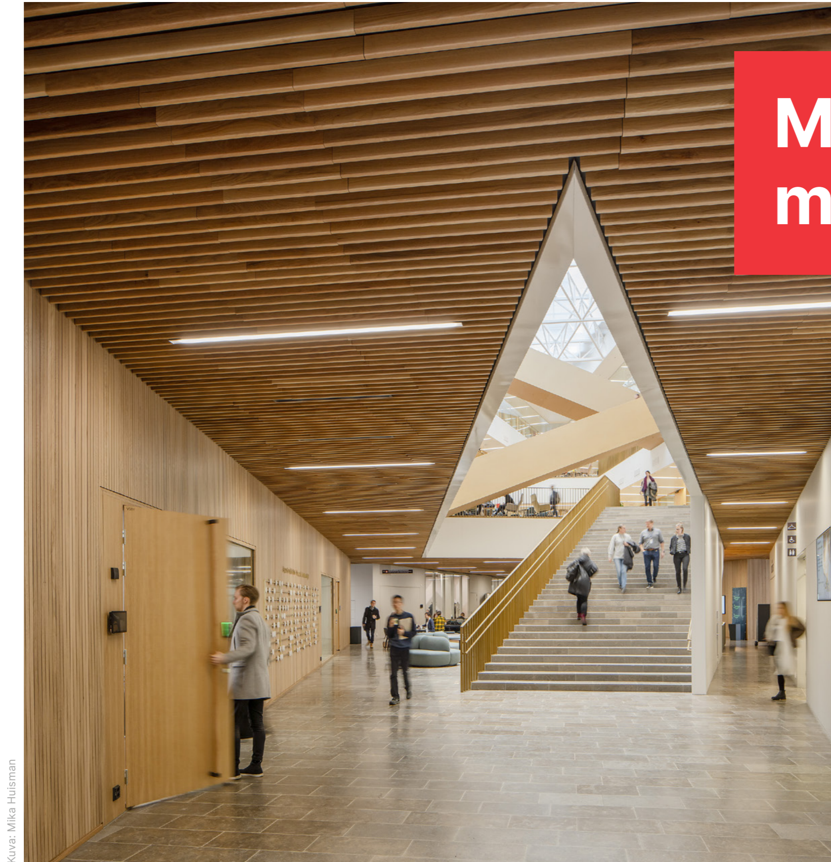
Kuva: Mika Huisman