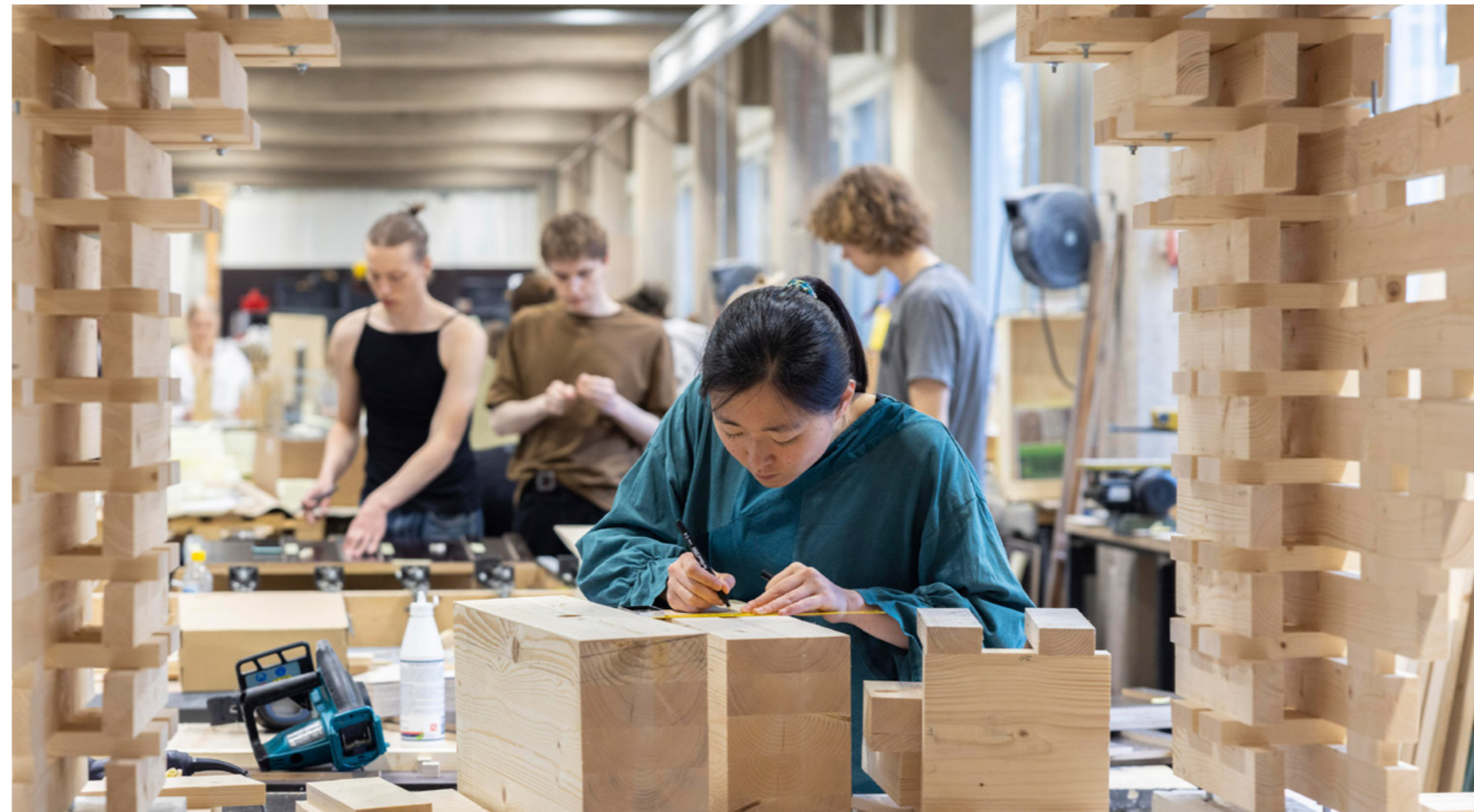
Kandidaattiopiskelijoista 50 (51) prosenttia ja maisteriopiskelijoista 23 (25) prosenttia suoritti tutkintonsa tavoiteajassa.

osoittautuneet vetovoimaisiksi. Niihin hakeutui ulkomaalaisten opiskelijoiden lisäksi myös suomalaisia opiskelijoita, joiden osuus oli 47 prosenttia paikan vastaanottaneista. Aalto-yliopisto houkutteli hakijoita myös kaksivuotisiin maisteriohjelmiin. Ohjelmiin saatiin yhteensä 9 015 (8 898) hakemusta. Suomen jälkeksi hakemuksia saatiin eniten Kiinasta ja Intiasta.