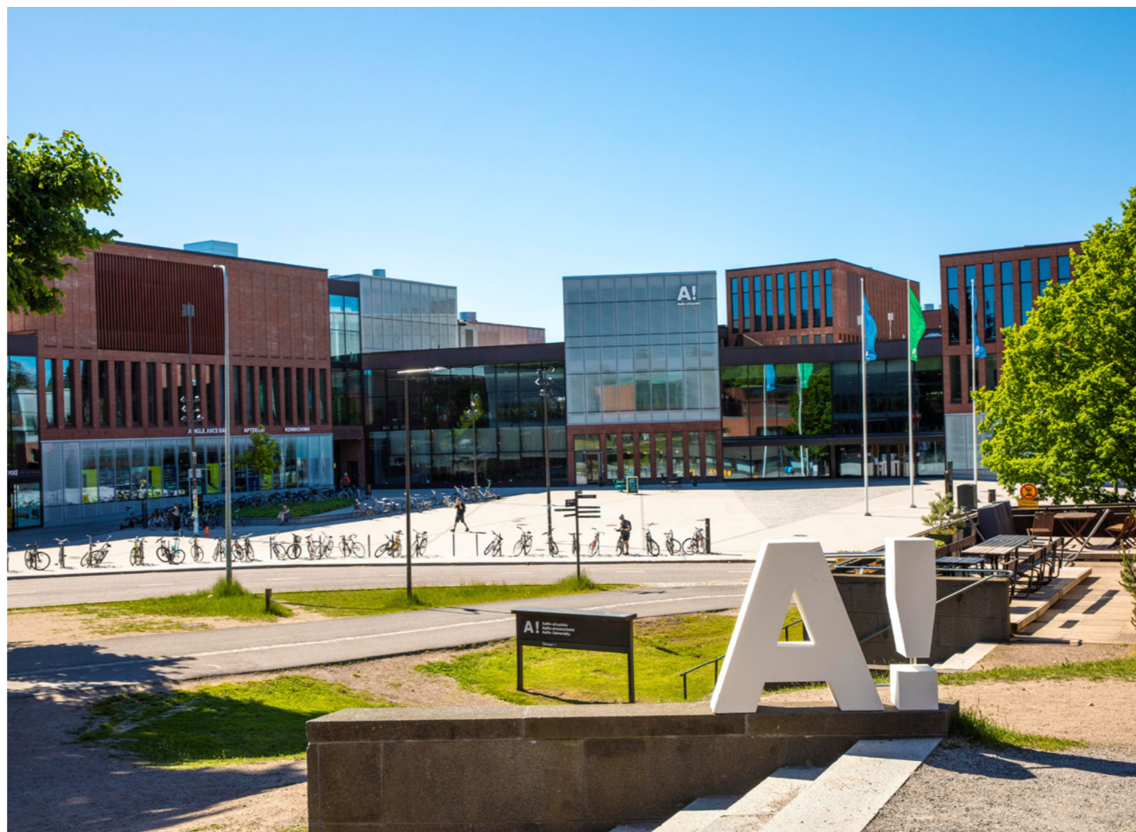
Aalto-korkeakoulusäätiö sr toimii Aalto-yliopistona. Säätiöyliopiston toimintaa säätelevät yliopistolaki (558/2009), säätiölaki (487/2015) ja säätiön säännöt.

Yliopisto noudattaa kaikessa toiminnassaan kansainvälisesti korkeatasoisen yliopistotoiminnan eettisiä periaatteita ja hyvää hallintotapaa sekä turvaa sisäisessä hallinnossaan opetuksen, tutkimuksen ja taiteen vapauden edellyttämän akateemisen itsehallinnon ja siihen olennaisesti kuuluvan professorikunnan riippumattomuuden.