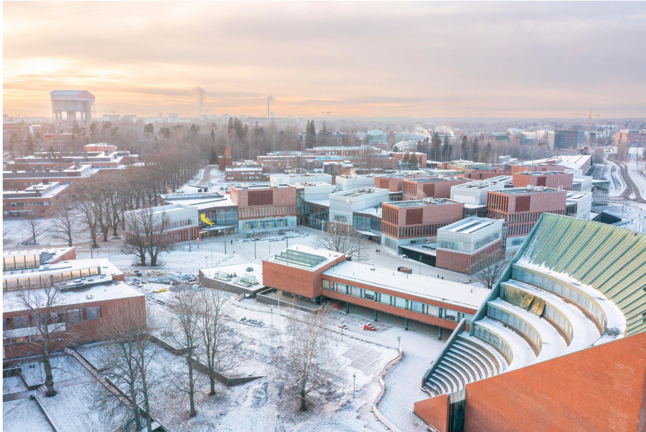
Aalto-yliopiston kampus sijaitsee Otaniemessä, jonne on muodostunut elävä ja innovaatioita tukeva kaupunginosa. Kampuksen kehittämisessä arvokas historia yhdistyy uudenlaiseen suunnitteluun.