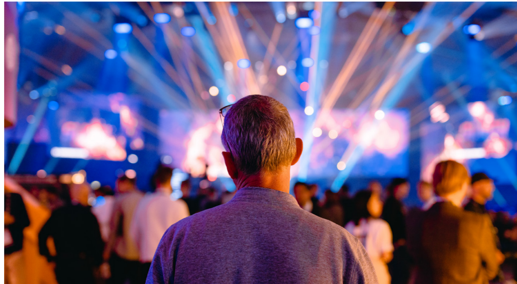
Aalto-yliopisto pyrkii kasvattamaan yhteiskunnallista vaikuttavuuttaan tuomalla yhteen kansainvälisiä ja kansallisia toimijoita.

Aalto-yliopiston toiminta yrittäjyyden edistämiseksi on tunnustettu maailmanlaajuisesti. Aalto-yliopiston Startup Center kuuluu maailman yliopistojen yhteydessä toimivien yrityskehittäjämöiden parhaimmiston tuoreen UBI Global -yrityksen vertailun mukaan. Startup Centerin vahvuuksiksi todettiin asiakaslähtöisyys, paikallinen ekosysteemi ja yleinen houkuttelevuus.